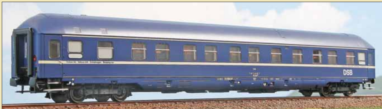
Carrozza letti Tipo WLABmh 174 delle DSB in livrea blu TEN Sleeping car 2nd class type WLABmh 174 of the Danish Railways in TEN blue livery. Schlafwagen Bauart WLABmh174 der DSB in blauer TEN-Lackierung.