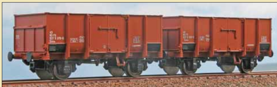
Set di due carri merci FS Tipo EkkIm con fondo di carico in metallo per carichi vari. Set of two FS Type EkkIm freight wagons with metal loading floor for various loads. Set aus zwei Güterwagen der Bauart FS EkkIm mit Metallladeboden für verschiedene Ladungen.