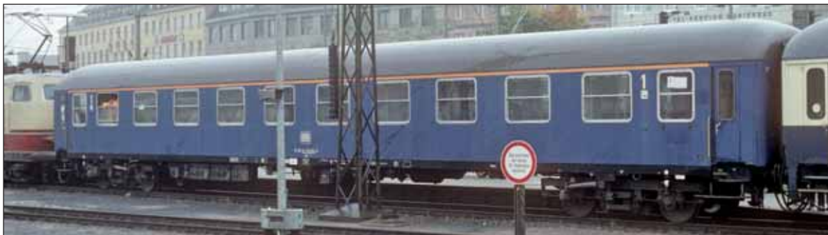
Carrozza DB Tipo X Am 203 di prima classe da 200 Km/h, livrea blu. Passenger car 1 st class type X (Am 203 ) of the DB, 200 Km/h, blue livery. 1.-Klasse-Wagen Typ X (Am 203 ) der DB, 200 km/h, blaue Lackierung.