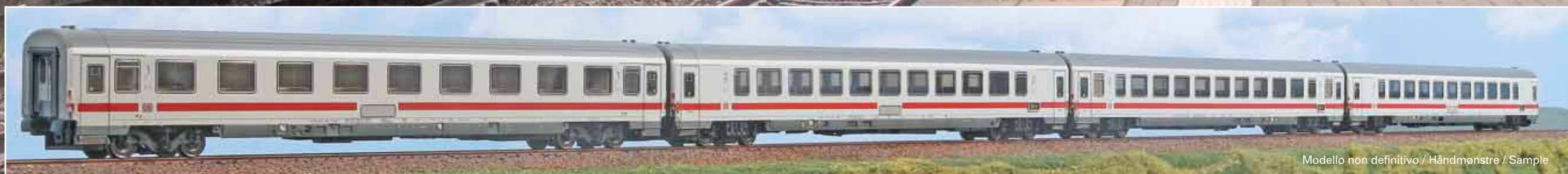
Modello non definitivo / Håndmønstre / Sample