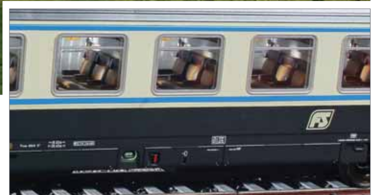
GC 1983 mit Riffeldach, einem Salonwagen Typ GC 1986 und er 90er zwischen Neapel, Rom und Mailand eingesetzt war.