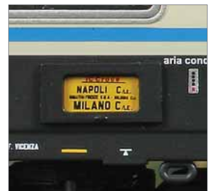
späckwagen Typ GC und einem Personenwagen Typ Z der FS, alle in GC Lackierung.