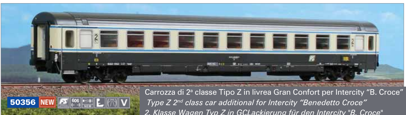
Carrozza di 2ª classe Tipo Z in livrea Gran Confort per Intercity "B. Croce" Type Z 2 nd class car additional for Intercity "Benedetto Croce" 2. Klasse Wagen Typ Z in GCLackierung für den Intercity "B. Croce"