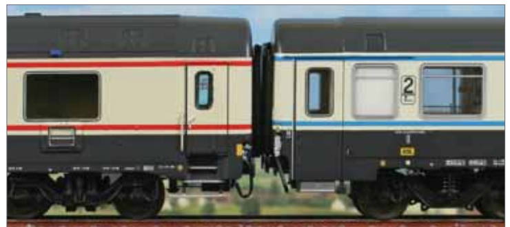
iner abteilwagen Typ GC 1986 und einer wagen Typ Z.