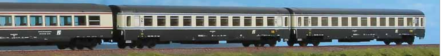
1983 con tetto cannellato, una carrozza salone Tipo GC agli inizi degli anni Novanta tra Napoli, Roma e Milano.