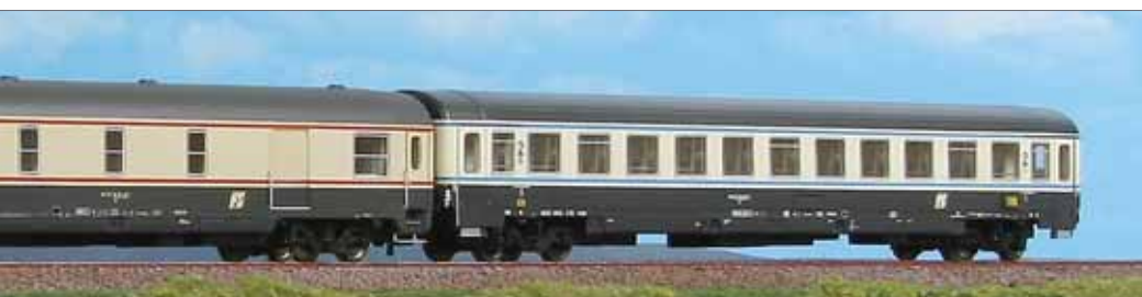
tto cannellato, un bagagliaio Tipo GC, ed una carrozza Tipo Z.