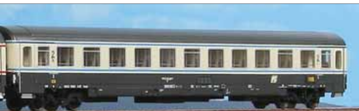
zza GC 1986 a scompartimenti con tetto cannellato, un